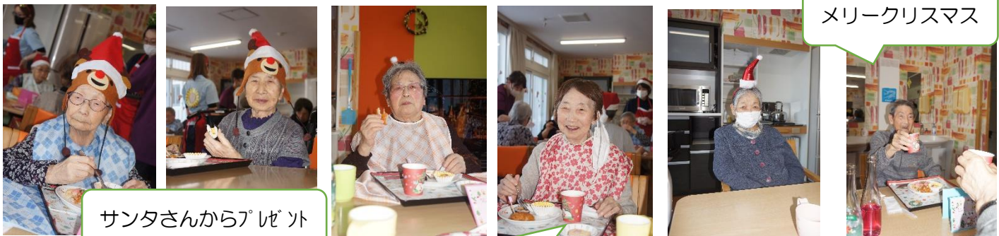
サンタさんからプレゼント